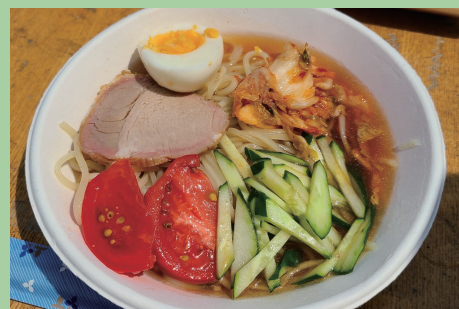
※画像はイメージです